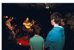
Zwischen zehn und 60 Jahren war alles vertreten: Der Cantona Liveclub war

Die Augen hält er geschlossen, seine Lippen berühren das kalte, silberne Mikrofon. Seine weiche Stimme durchflutet den Raum, die Saiten seiner Westerngitarre vibrieren unter der Berührung seiner Finger.